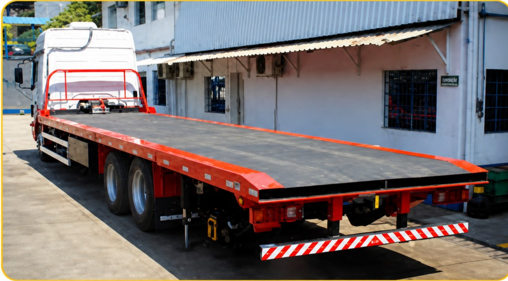
Guincho plataforma para veículos pesados