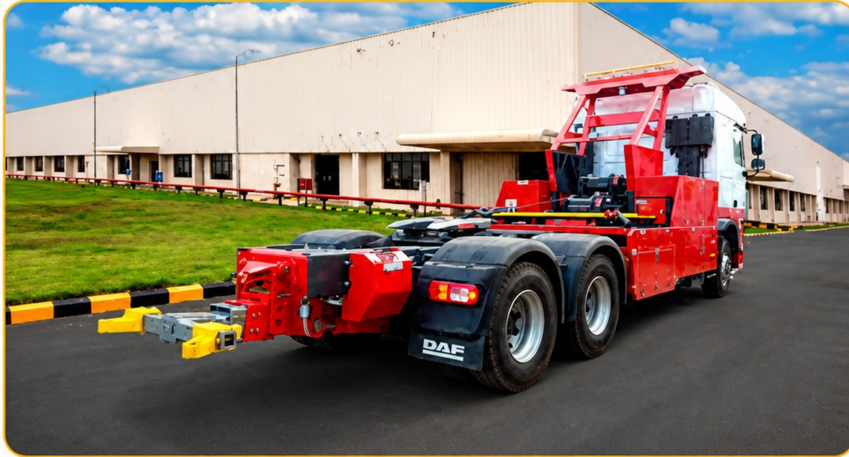
Guincho extrapesado tipo lança