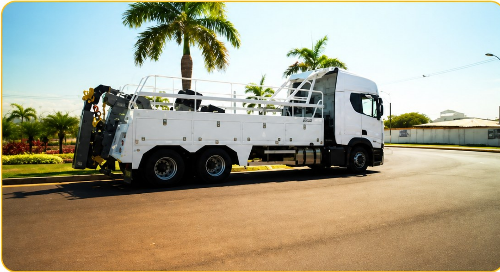
Guincho extrapesado tipo Scorpion