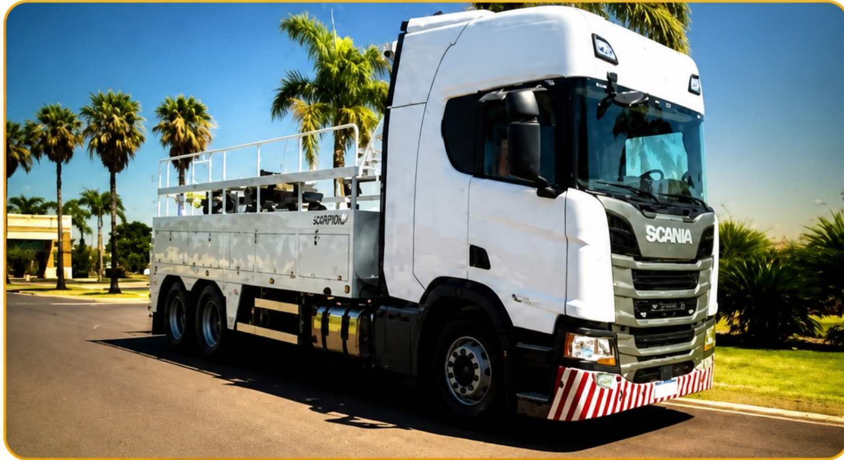
Guincho extrapesado tipo Scorpion