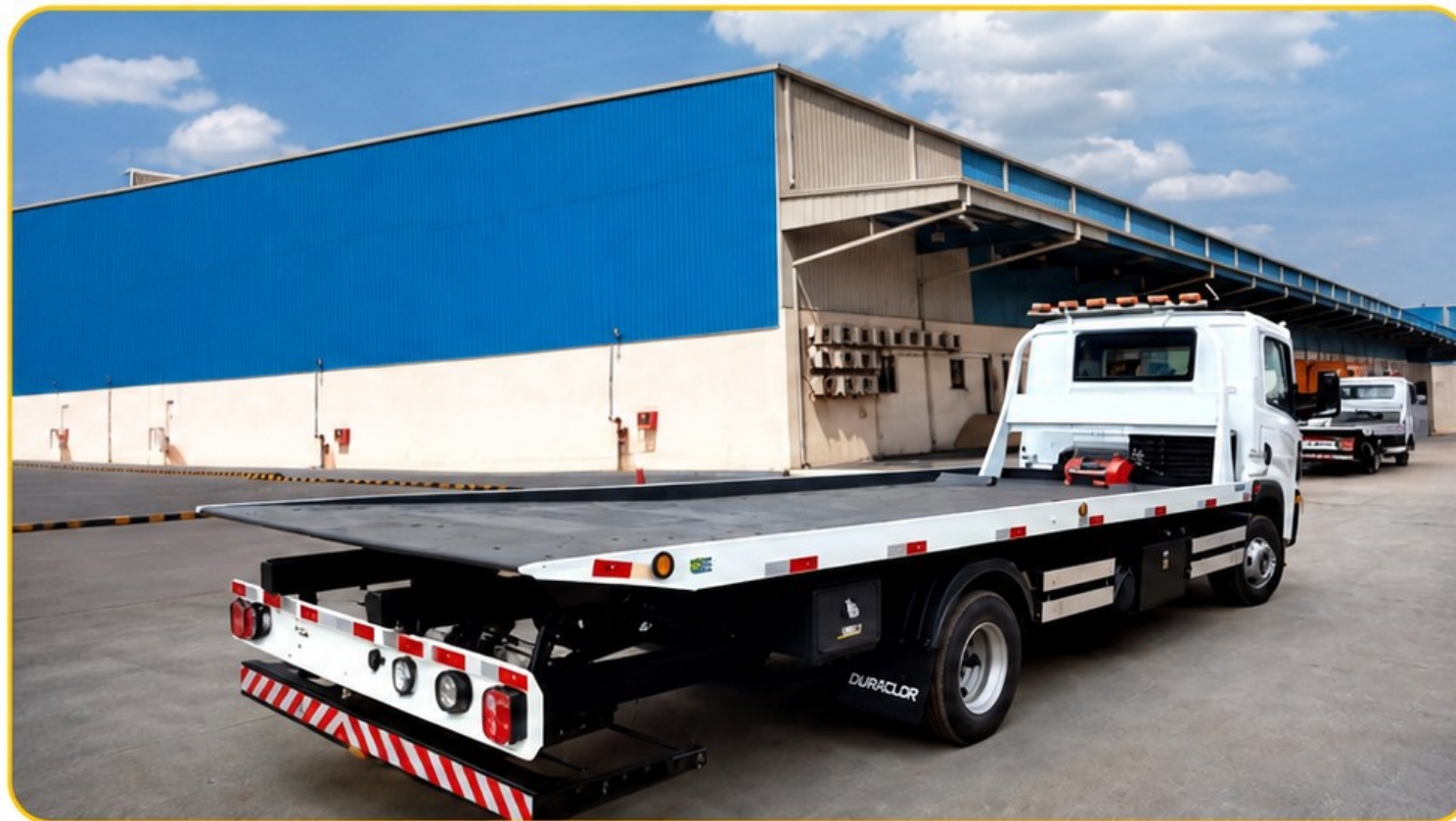
Guincho plataforma para veículos leves e utilitários